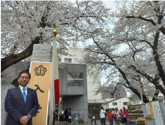
第一小学校の入学式は満開の桜の樹の下で！ ご入学おめでとうございます！（4月8日）

第1回定例会が3月26日で閉会し、小金井市議会では第2回定例会前の閉会中委員会審査が開催されています。3つの常任委員会、2つの特別委員会、議会運営委員会の合計6つの委員会が設置されている小金井市議会では必ず閉会中も最低1回は委員会を開会し、市民の皆様から寄せられた陳情を審査したり、所管する政策テーマに基づいた調査や質問を行っています。