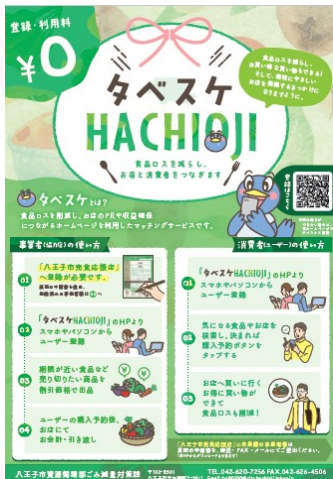
八王子市食べすけのチラシ